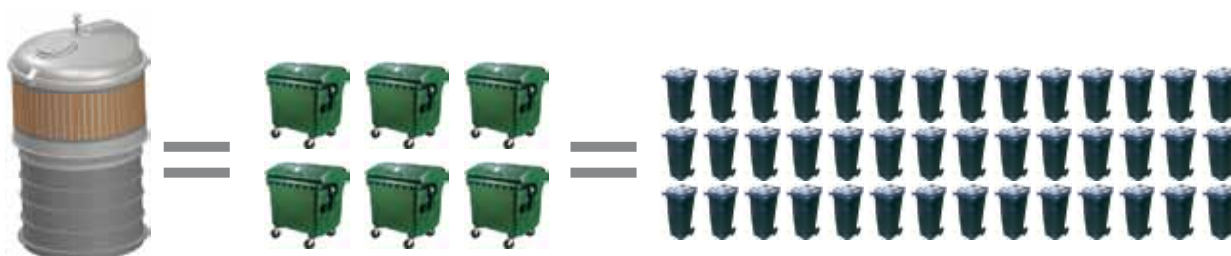
Usporedba između 5000L ECOdip kontejnera, 6 kom. kontejnera s kotačićima i 42 kom. 120L kućnih kontejnera